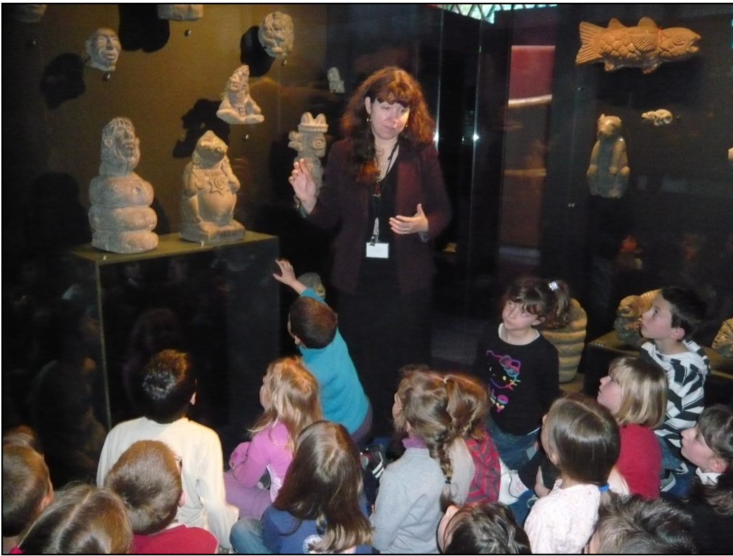
Avec la guide, le matin, devant le dieu serpent Quetzalcoatl.