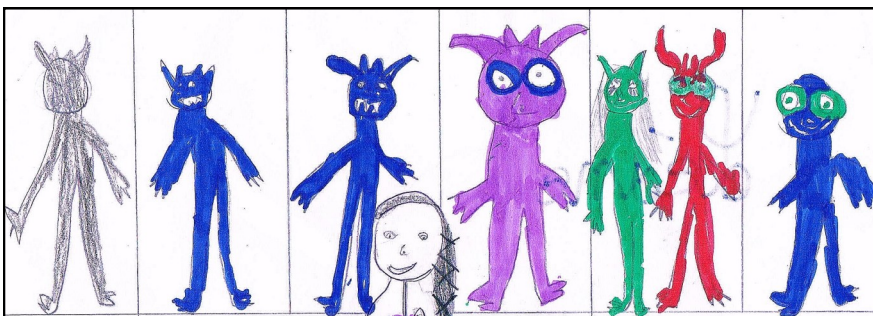
Katalina est en train de raconter des histoires. (Léane)

Katalina est en train de raconter des histoires.