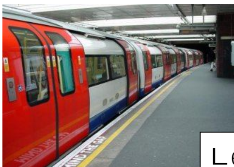
Le tube : métro londonien