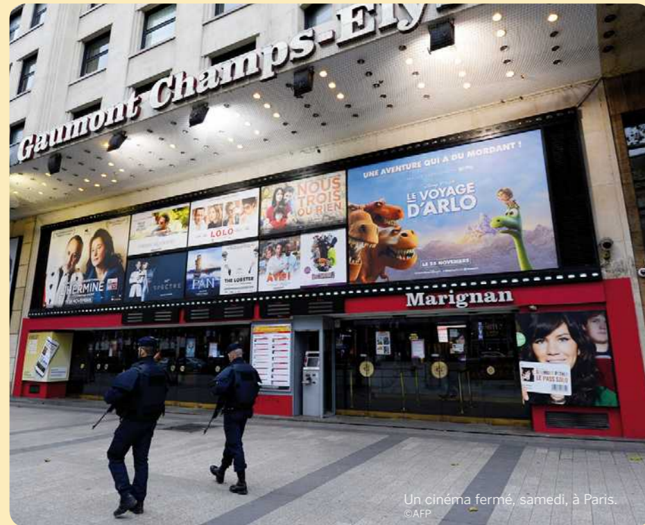
Un cinéma fermé, samedi, à Paris.