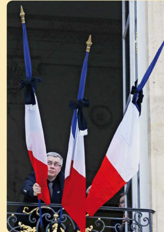
Cet homme plie des drapeaux au palais de l'Élysée.