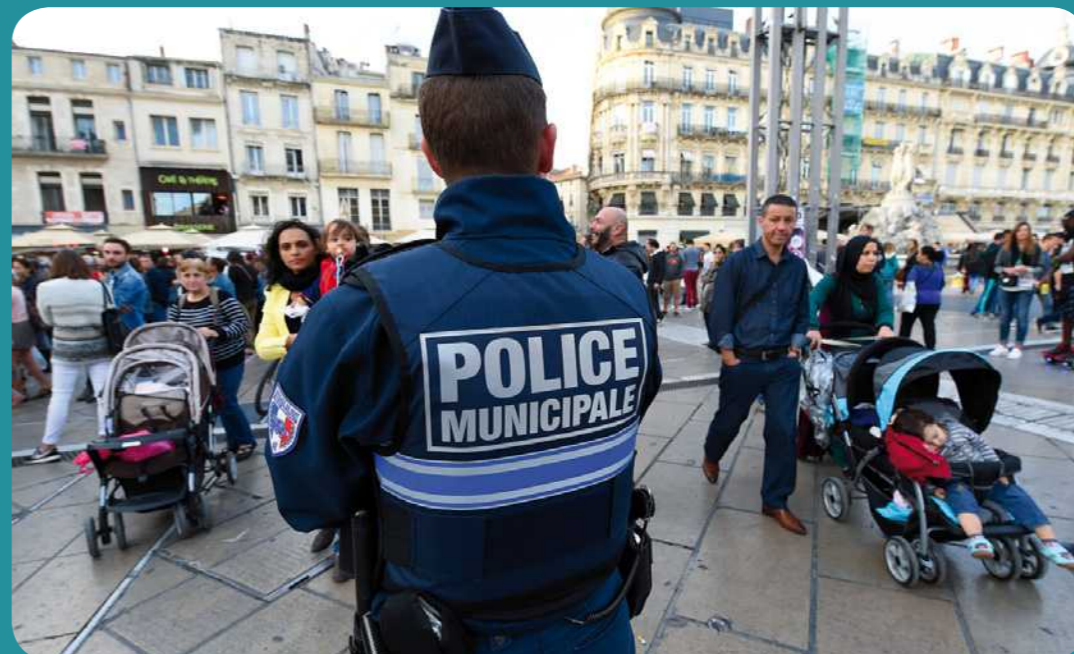
Un policier surveille une place de Montpellier, dans l'Hérault (sud de la France), samedi