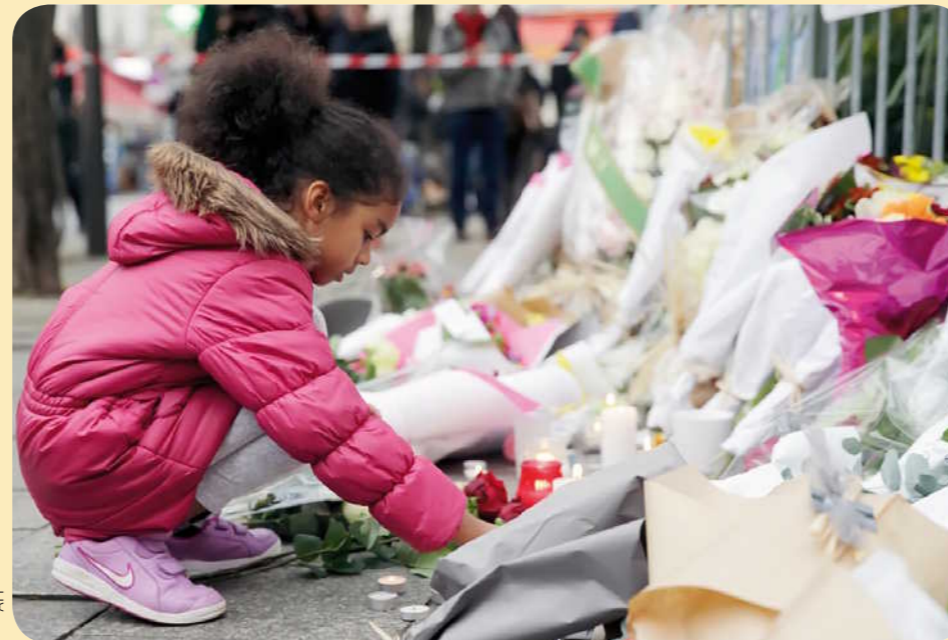
Des hommages. Des personnes déposent des bougies ou des fleurs devant les lieux des attaques ou dans d'autres endroits de Paris.

Dans le monde. Des monuments ont été éclairés aux couleurs du drapeau français. Ici, l'opéra de Sydney, en Australie (Océanie).