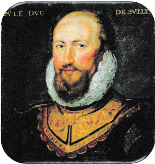
Maximilien de Béthune (Duc de Sully)

Il savait aussi commander. Au Parlement de Paris qui lui faisait des reproches sur l'Edit de Nantes, il déclara : « Je l'ai fait pour le bien de la paix. Je suis roi et je veux être obéi. »