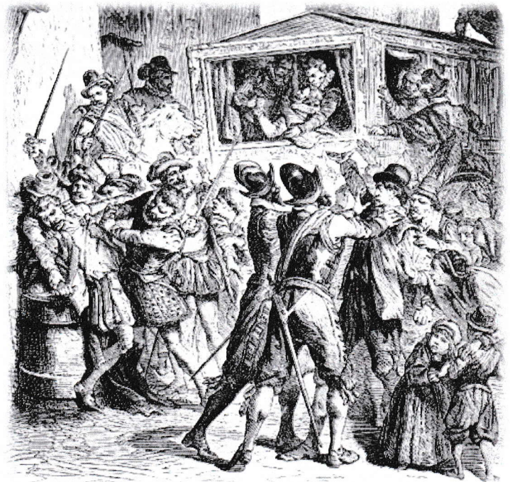
Assassinat d'Henri IV par Ravallac le 14 mai 1610 à Paris.

• En 1610, la France était à nouveau prospère. Malheureusement, Henri IV fut assassiné... Par Ravallac ..., qui l'accusait, injustement, de soutenir les protestants. Sa mort causa, dans tout le royaume, une grande douleur.